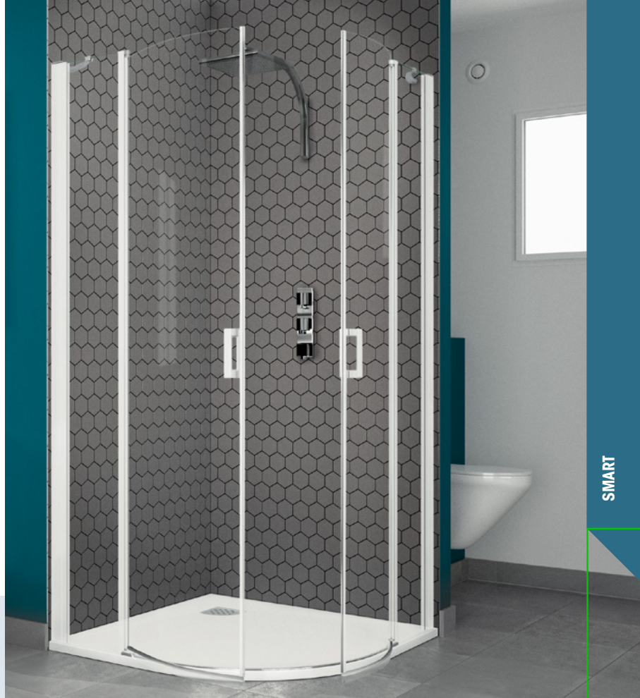
Smart R/P schwellenlos – weißes Profil – Klarglas