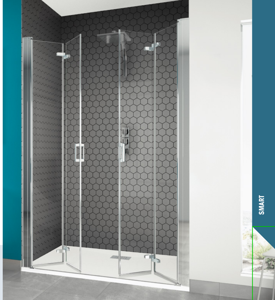
Smart S XXL schwellenlos – verchromtes Profil – Klarglas